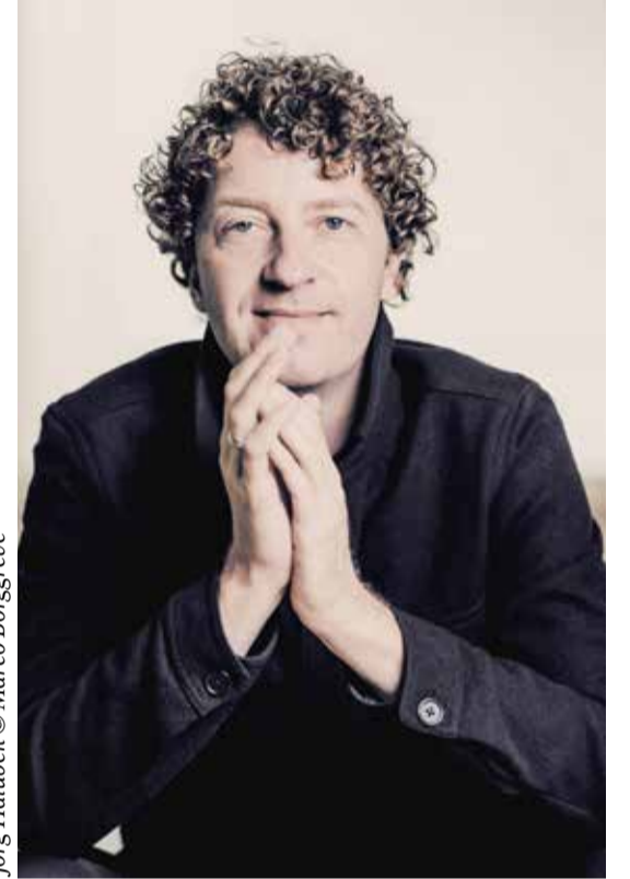
Jörg Halubek

✘ il Gusto Barocco / 26. Mai / Liederhalle, Mozart-Saal / Karten für Mitglieder: 30-47 €