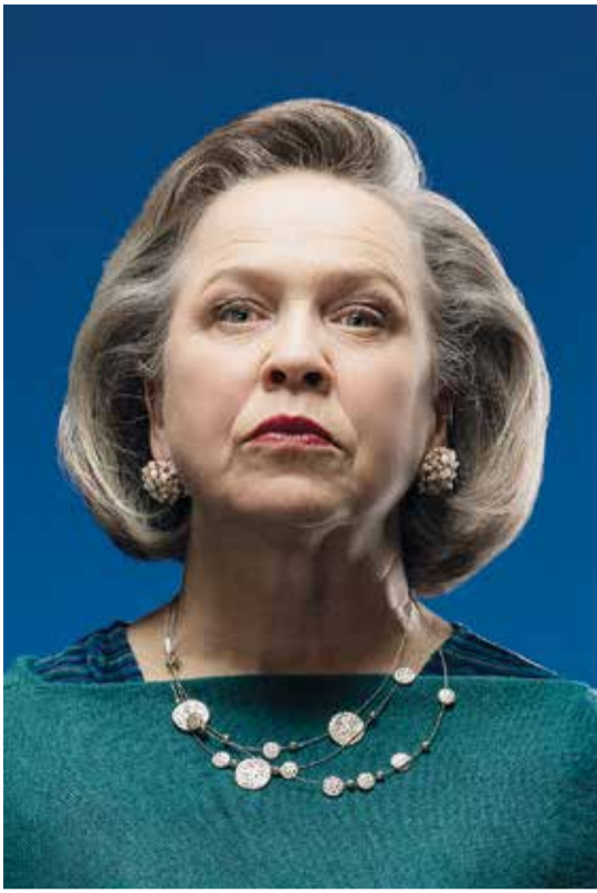
Wunderheiler © Martin Sigmund