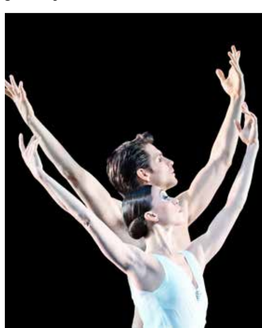
Fünf für Hans © Stuttgarter Ballett

✗ Ballettabend: Fünf für Hans / 27., 29., 31. Mai / Opernhaus Stuttgart / Karten für Mitglieder: 51-118 €