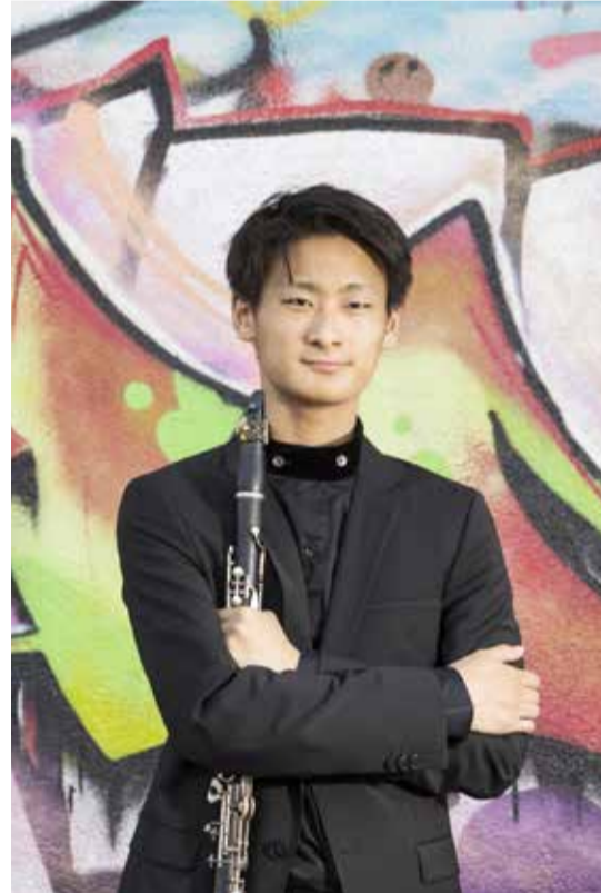
Lyuta Kobayashi

✘ Sein oder Nichtsein / 24., 25., 27., 28. Mai / Theater der Altstadt / Karten für Mitglieder: 21 €