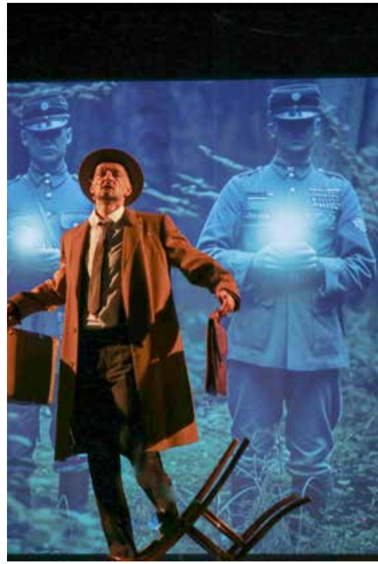
Der Reisende © Laura Kifferle

✘ Wunderheiler / 7., 8., 13.-15., 20., 24., 27. Mai / Altes Schauspielhaus / Karten für Mitglieder: 17-24 €