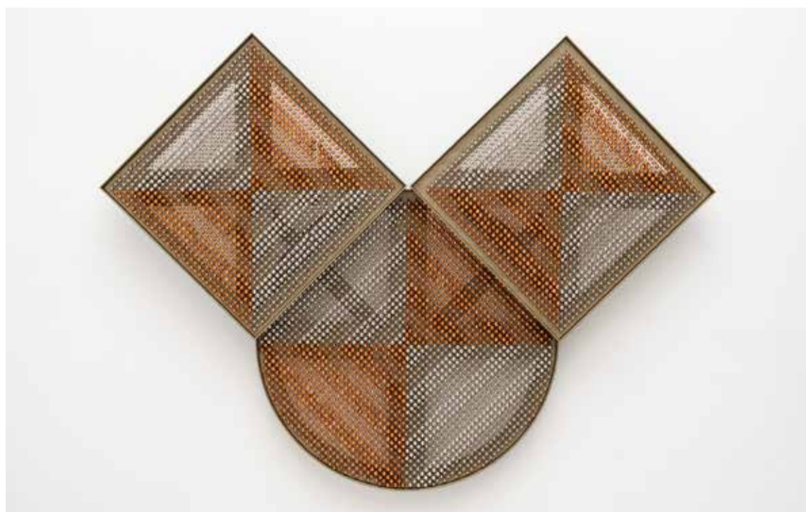
Haegue Yang: Sonic Rotating Triovular Geometric Triplets – Copper and Silver, 2021 © Haegue Yang

Film: Wer nicht kämpft, hat schon verloren – Willi Bleicher, Widerstandskämpfer und Arbeiterführer