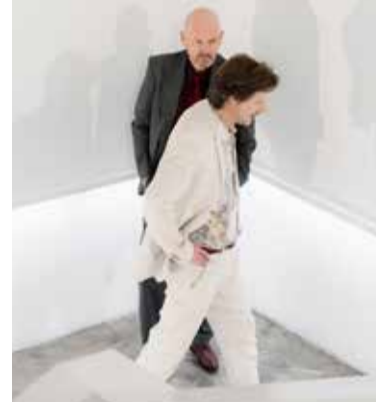
Das Urteil © Jan Merkle

3.5. 20:00-22:00 Uhr Sa Forum Theater Stuttgart ✗ Das Urteil Autor Paul Hengge Inszenierung Edith Ehrhardt Der jüdische Antiquar Rabinovicz, der in einem Mordprozess aussagen soll, wird von einem geheimnisvollen Fremden in ein Gespräch verwickelt, das bald um die Schwierigkeiten bei der Suche nach Wahrheit und Gerechtigkeit kreist.