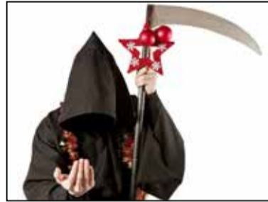
DER TOD Tödliche Weihnacht 1 © Anja Pankotsch

31.5. 20:00 Uhr Sa Renitentztheater ✗ Der Tod - BEST OF - Death Comedy Best-Of-Programm über Radieschen von unten über die Tücken der deutschen Friedhofsverordnung bis hin zum Urlaub im Aufpust-Sarg: Der letzte Reiseführer ist ein Vollprofi.