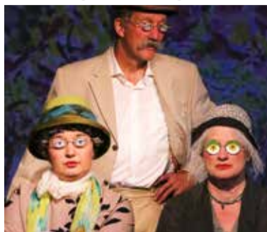
Ewig und drei Tage

30.5. 20:00-21:45 Uhr Fr Wortkino Dein Theater ⊗ Ewig und drei Tage Autoren Hans Rasch und Norbert Eilts Alter als einziges Mittel für langes Leben.