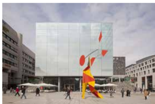
Kunstmuseum Stuttgart

Das Kunstmuseum Stuttgart feiert dieses Jahr sowohl 100 Jahre städtische Kunstsammlung als auch 20 Jahre Neubau Kunstmuseum. Der nicht unbedingt ansprechende Name der Ausstellung „Doppelkäseplatte“ bezieht sich auf das gleichnamige Werk von Dieter Roth, das im ersten Ausstellungsraum zu sehen ist. Verschiedene Käsesorten zwischen zwei Glasplatten schimmeln und zersetzen sich dort seit 1968 und ergeben sich wandelnde Ansichten. Dieses Sinnbild ständiger Veränderung ist auch Ausgangspunkt für die Überlegungen, wie sich die Sammlung entwickelt und die Bedeutung einzelner Werke sich im Lauf der Zeit verändert haben. Die Ausstellung greift diese Gedanken auf und ist dementsprechend weder chronologisch noch thematisch konzipiert, sondern ist in mehrere Themenräume gegliedert, die von verschiedenen Kurator*innen des Hauses erarbeitet wurden.