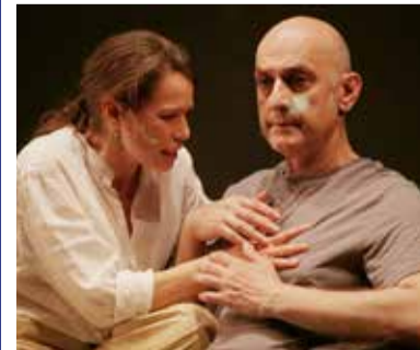
Illusionen