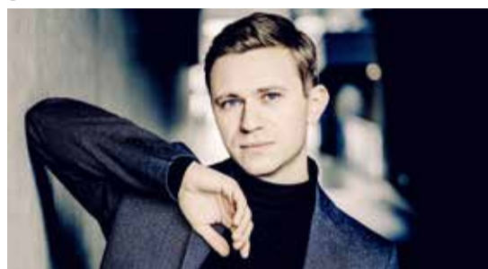
Dmytro Choni

✗ Cannstatter Klavierfrühling / 4. Mai / Großer Kursaal, Bad Cannstatt / Karten für Mitglieder: 20 €