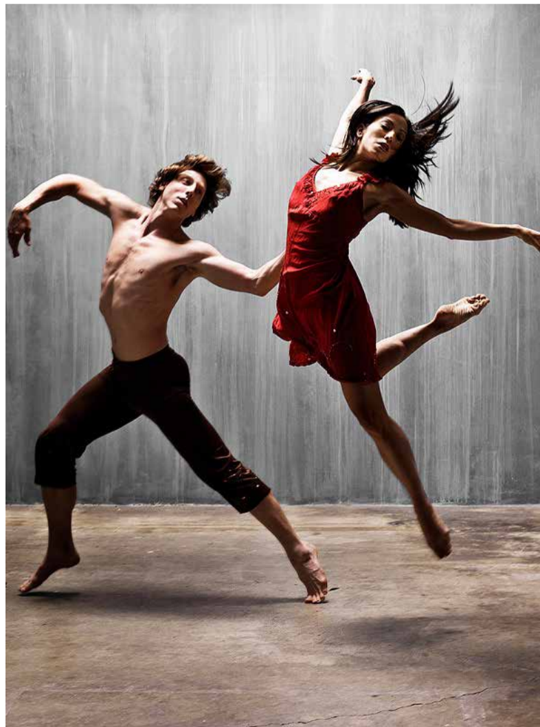
Zwei Tänzer des Modern Ballet Brasileiro © Barry Goyette ca

„WESTSIDE STORY“ UND „ROMEO UND JULIA“ TREFFEN ... AUF DEN „KLANG DER BILDER“ Leonard Bernsteins »West Side Story«, eine der originellsten Bearbeitungen von Shakespeares »Romeo und Julia«, spielt im New York der 1950er-Jahre. Sie verbindet Oper, Jazz und lateinamerikanischen Tanz. Auszüge von Sergej Prokofjews Ballett wurden noch vor der Uraufführung konzertant aufgeführt. Timo Brunkes Texte schaffen eine kongeniale Verbindung zwischen den Welten Shakespeares und Prokofjews. – In der Staatsgalerie begegnen wir dem »Klang der Bilder«, entdeckten Analogien zwischen Malerei und Musik in den Werken Kandinskys, Jackson Pollocks, Yves Kleins und Ad Reinhardts. Mark Rothko suchte mit tiefen, sinnlichen Farben nach Kontemplation und perfekter Klangbalance – die faszinierenden Gemälde der Nachkriegsavantgarde mit ihren Dissonanzen und Harmonien gleichen Partituren einer unbekannteren Melodie. KUNSTERLEBNIS Stuttgart Samstag, 05.11.2025, 14.45 Uhr Leitung Ricarda Geib LEISTUNGEN Führung mit Ricarda Geib; Konzert mit den Stuttgarter Philharmonikern: Karte der Kategorie I, Sprecher: Timo Brunke; Imbiss (1 Kaffee/Softdrink, 1 Kuchen/Brezel), VVS-Berechtigung Mindestteilnehmerzahl 16 Personen Mitglieder 79 Euro, Freier Verkauf 89 Euro