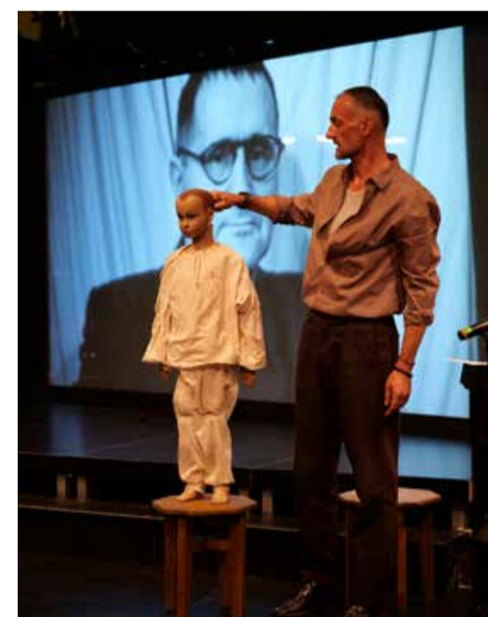
Ich, Bertold Brecht-Probenfoto

Es lohnt sich in jedem Fall, den literarischen Brecht-Abend in der Tri-bühne zu besuchen. Dabei kommt übrigens nicht nur der Agent zu Wort: Es wird auch viel live gesungen und deklamiert. Bei aller Faszination für KI bleibt für László Bagossy eines selbstverständlich: „Das Theater bleibt ein Ort der Lebendigen. Die Schauspieler stehen im Mittelpunkt.“