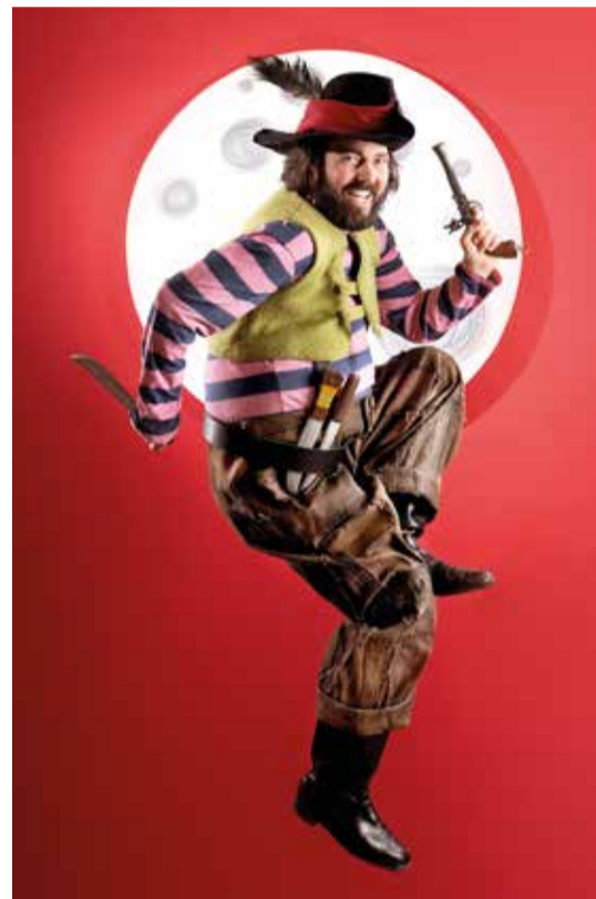
Der Räuber Hotzenplotz und die Mondrakete

✘ Der Räuber Hotzenplotz und die Mondrakete / 30. November / Komödie im Marquardt / Karten für Kinder 8 €, für Erwachsene 16 €