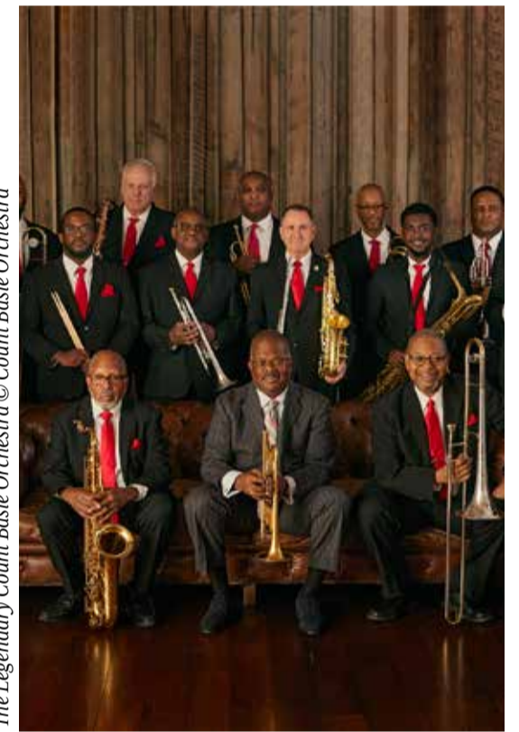
The Legendary Count Basie Orchestra

✘ The Legendary Count Basie Orchestra / 15. November / Backnanger Bürgerhaus / Karten für Mitglieder: 32-40 €