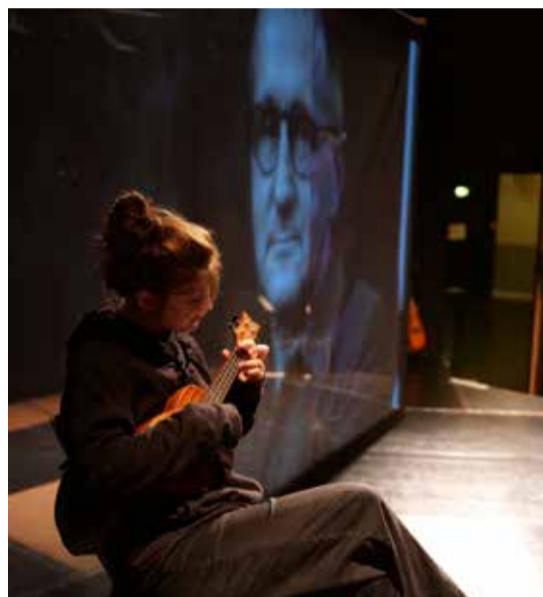
Ich, Bertold Brecht-Probenfoto

„Was hätte die Person XYZ dazu gesagt?“ – das ist ein Gedankenspiel, das Menschen von jeher inspiriert. Ob Sokrates, Jesus oder Hannah Arendt: Es ist reizvoll, im fiktiven Dialog historische Persönlichkeiten in die Gegenwart zu holen und ihre Haltung zu heutigen Fragen zu imaginieren. Dabei ist klar, dass die Antworten Mutmaßungen sind – eine Hochrechnung der eigenen Überzeugungen und Zweifel.