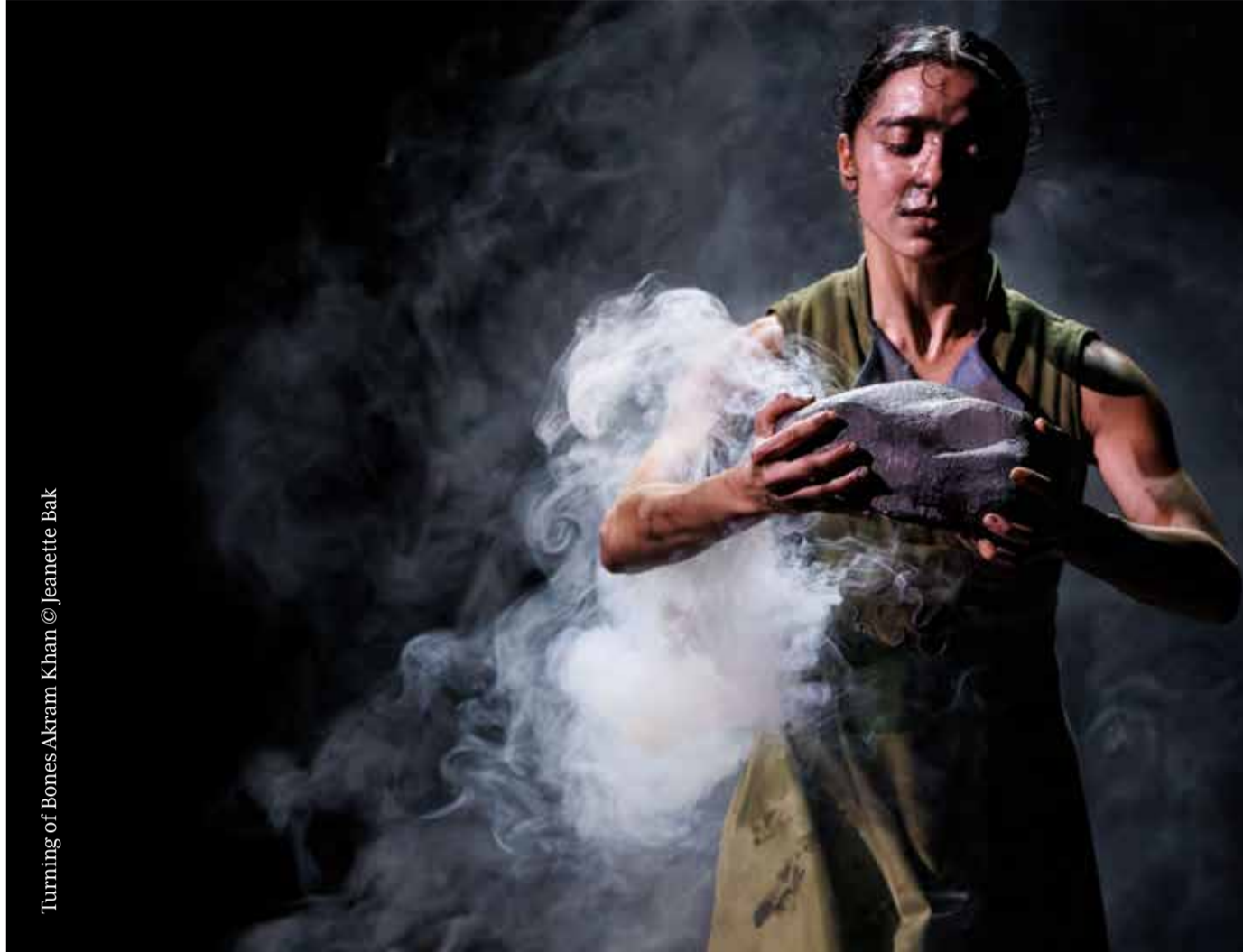
Turning of Bones Akram Khan