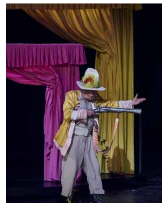
Der Räuber Hotzenplotz

✗ Der Räuber Hotzenplotz / 16. u. 30. November / Staatsoper Stuttgart / Karten für Mitglieder: 49-100 €