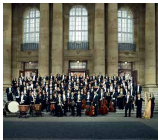
Staatsorchester Stuttgart

✗ Staatsorchester Stuttgart / 23. u. 24. November / Liederhalle, Beethoven-Saal / Karten für Mitglieder: 21-36 €