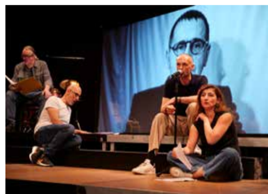
Ich, Bertold Brecht-Probenfoto