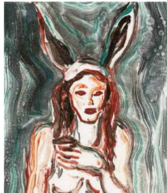
Die schlaue Füchsin © Ulrike Theusner, Courtesy of Galeria EIGEN + ART, Leipzig Berlin

✗ Die schlaue Füchsin / 14., 21., 23., 26. November / Staatsoper Stuttgart / Karten für Mitglieder: 51-118 €