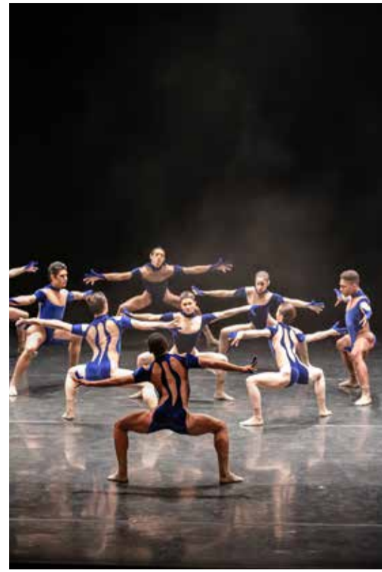
São Paulo Companhia de Dança

✘ Der zerbrochne Krug / 5., 6., 8., 11., 18.-20., 25. November / Altes Schauspielhaus / Karten für Mitglieder: 14-27 €