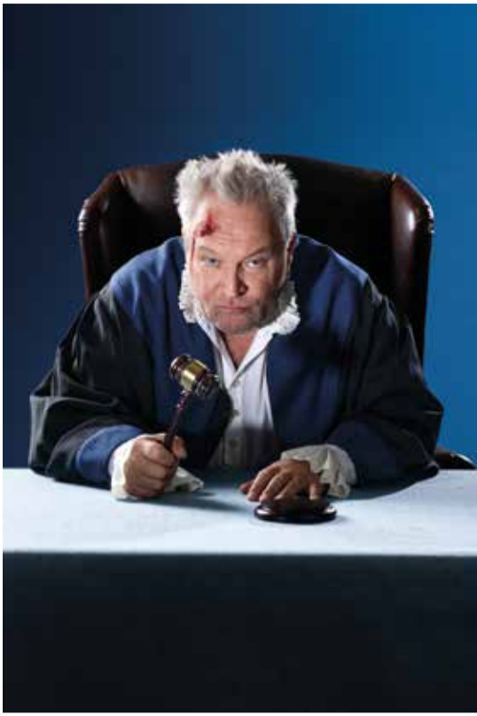
Der zerbrochne Krug © Martin Sigmund