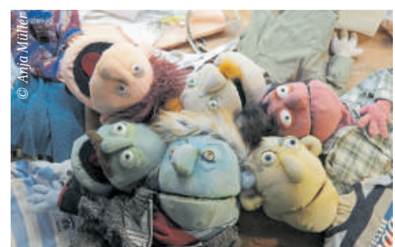
Mit einem fertigen Bastelset leicht selbst herzustellen