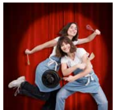
Gierig und Gefräßig

Ein Abend, einzuordnen zwischen Kochshow, Comedy und Chaos.