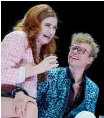
Wer hat Angst vor Virginia Woolf