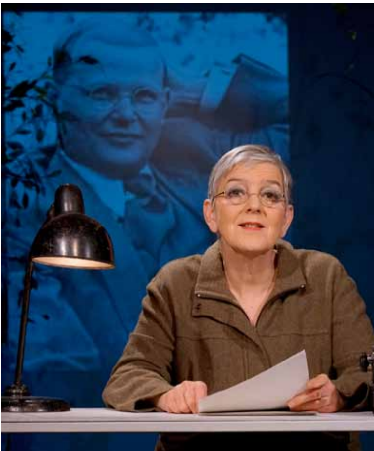
Dietrich Bonhoeffer