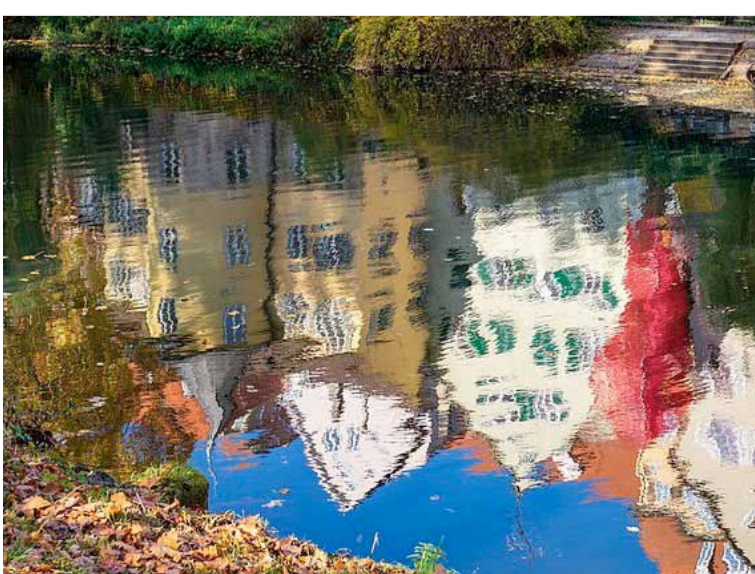
Tübingen, Spiegelung der Neckarfront