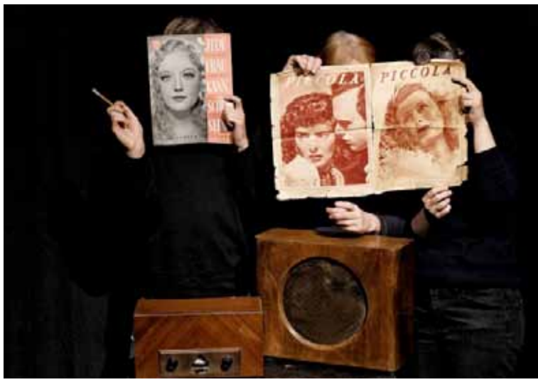
100jährige Dinge erzählen

So 05.07.2026 18.00 S Geld liegt uff dr Bank