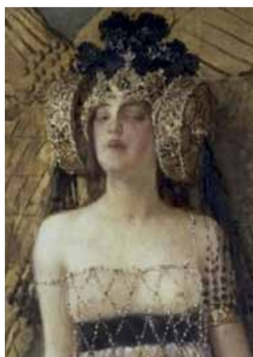
Semiramis