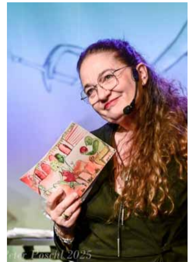
Gefährliche Liebschaften

Literatur & Musik über die Jahrhunderte mit Geschichten und Gedichte von Adligen, Mätressen und den Huren Babylons.