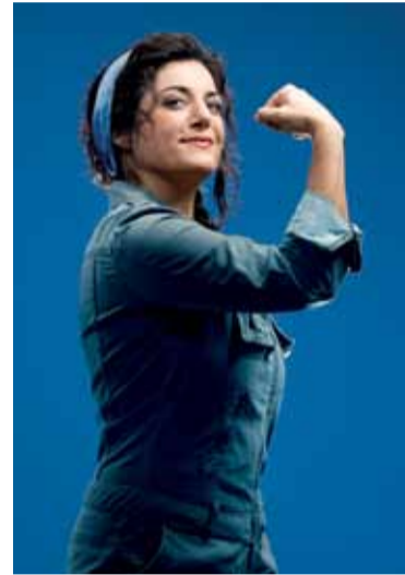
Die Optimistinnen