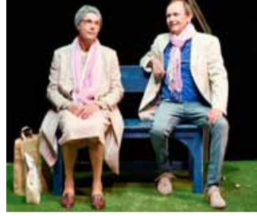
Du bist meine Mutter

Mo 20.07.2026 20.00 Du bist meine Mutter ⊙ Theaterhaus - T4 Autor: Joop Admiraal Inszenierung: Werner Schretzmeier Ein berührendes Stück über Hilfsbedürftigkeit und Abhängigkeit.