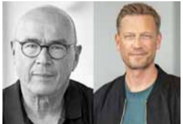
Weber & Dogs

Willkommen in der Mitte des Lebens! Was ist hier los? Sind wir angekommen, wo wir hinwollten? Wie schaffen wir es, zufrieden zu sein?