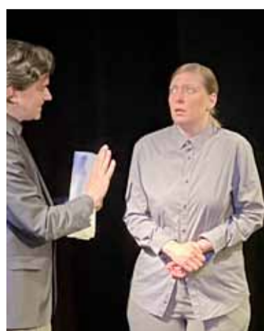
Der Mieter