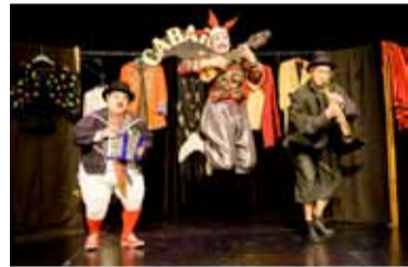
Accademia DimitriTheater der Altstadt

Do 16.07.2026 20.00 Accademia Dimitri VaRRRiété Forum Theater Stuttgart Abenteuer auf hoher See Variété-Spektakel, das Tanz, Akrobatik, Clownerie und Theaterkunst miteinander verbindet.