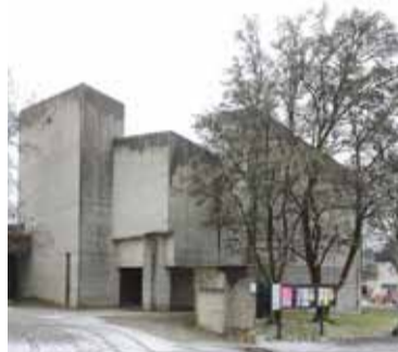
Sonnenbergkirche Stuttgart-Sonnenberg

1966 übergab der Züricher Architekt Ernst Gisel die Sonnenbergkirche samt Gemeindezentrum der Kirchengemeinde. Im Jahr darauf erhielt er für diesen exemplarischen Sakralbau der Ära Beton brut den Architekturpreis der Stadt Stuttgart. 2014 wurde das Ensemble unter Denkmalschutz gestellt. Bei der großartigen Initiative von 2019, den »Kirchenbau der Nachkriegsmoderne in Baden-Württemberg« umfassend zu würdigen, kam die Sonnenbergkirche unter »die Zwölf«, die besonders hervorgehoben wurden. Exponiert und zugleich introvertiert setzt sich diese Architektur gekonnt in Szene! Die Kirchenspende ist vor Ort zu entrichten. ARCHITEKTURRUNDGANG Führung: Michael Wenger