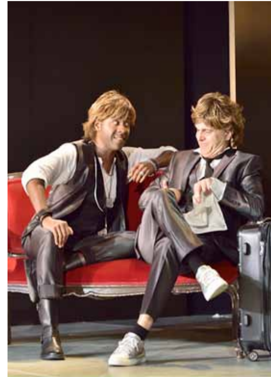
L'occasione fa il ladro © Patrick Pfeiffer

Rossinis »Gelegenheit macht Diebe« beginnt mit einer dramatischen Gewitterszene in einer Herberge, die an das Finale von Don Giovanni erinnert: Parmenione speist seelenruhig zu Abend, während sein ängstlicher Diener Martino leidet. Parmenione ist ein schillernder Charakter, dauernd verstellt er sich, lügt, erfindet sich neu, manipuliert und quält nebenher seinen Diener. Auf der Suche nach einer Zuflucht vor dem Regen kommt Alberto herein, der zu seiner ihm unbekannteren Braut unterwegs ist. Als Parmenione den Koffer des Reisenden mit seinem tauscht, nimmt eine aberwitzige Geschichte ihren Anfang. Parmenione findet ein Bild einer jungen Frau und Albertos Pass und beschließt, dessen Identität zu rauben. Er macht sich auf die Suche nach der vermeintlichen Braut. Doch die hat eigene Pläne und denkt überhaupt nicht daran, irgendeinen vorbestimmten Bräutigam zu heiraten.