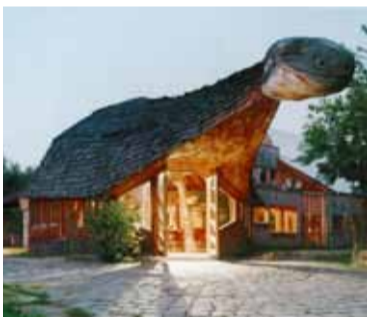
Piotr Anderszewski