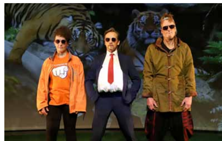
Achtsam morden durch bewusste Ernährung