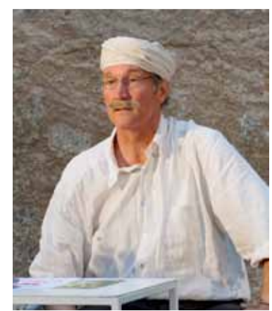
Reiselust