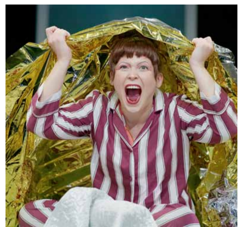
Wonderland Ave © Anton Audiev