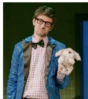
Konfetti © Anton Auditeiov

Autor: Ingrid Lausund Inszenierung: Christine Gnnann Ein Lehrstück für politisch Verwirrte.