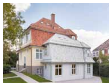
Hölzelhaus Stuttgart © Adolf Hölzel Stiftung

Die Werke des bedeutenden Künstlers Camille Graeser, der von Adolf Hölzel die Grundlagen der Farbtheorie erlernte, zeigen eindrucksvoll seine individuelle Weiterentwicklung und den