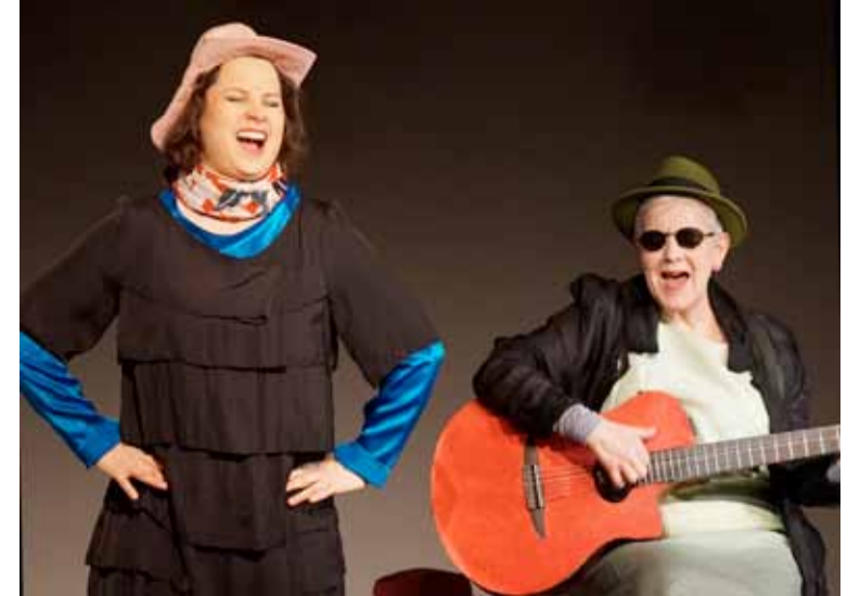
50 Jahr blondes Haar

Sa 25.07.2026 20.00 Es war einmal ein Mord ⊙ Theater Atelier