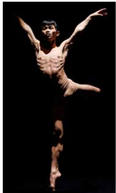
Radical Classical © Jeanette Bak