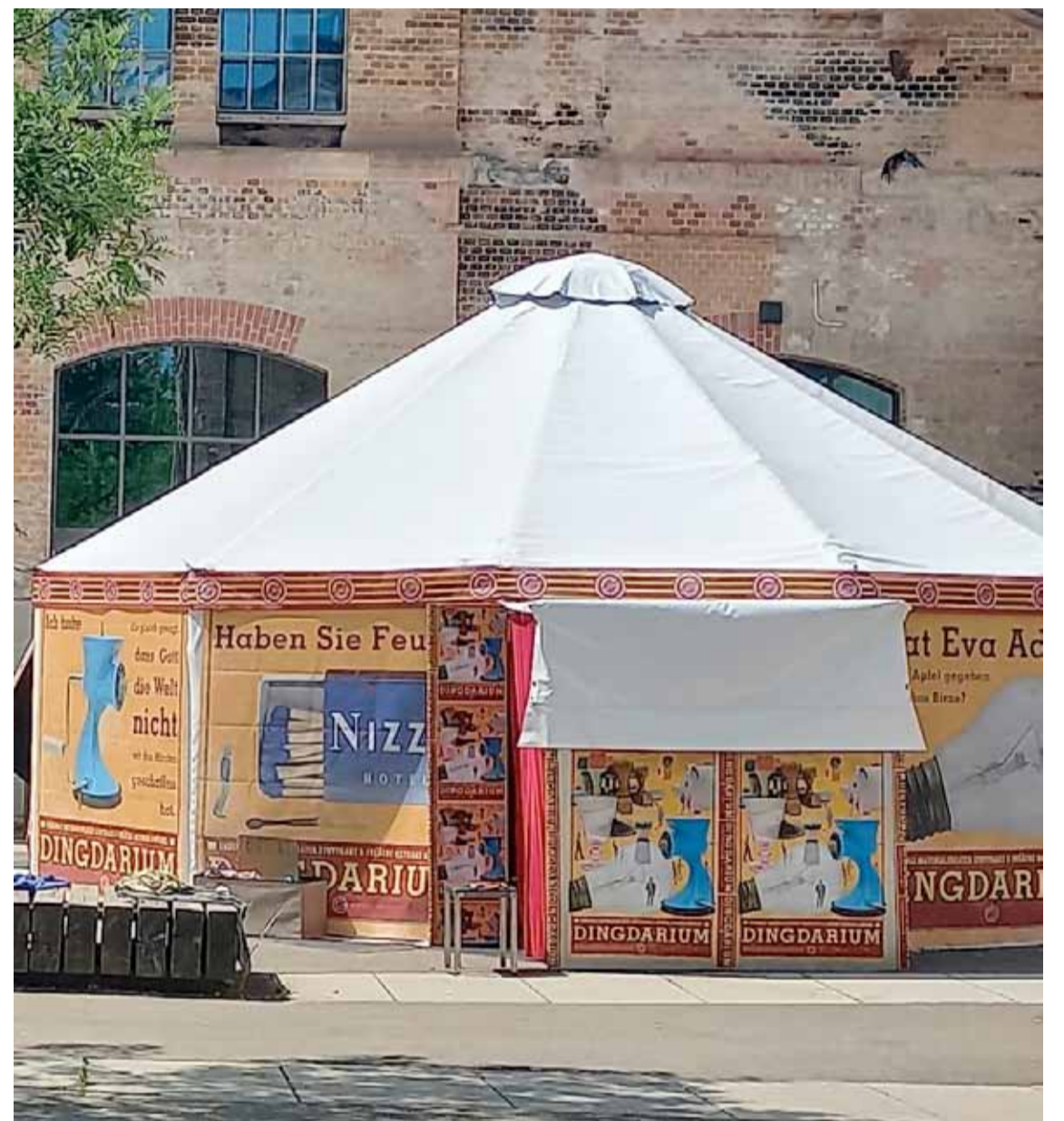
Materialtheater Zelt