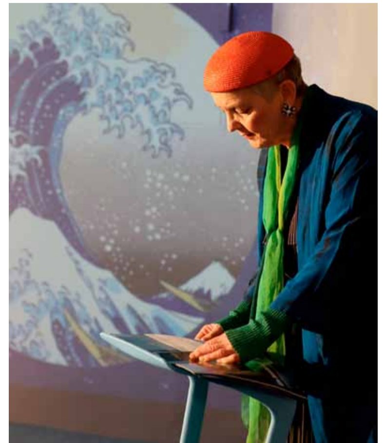
Allesfließt