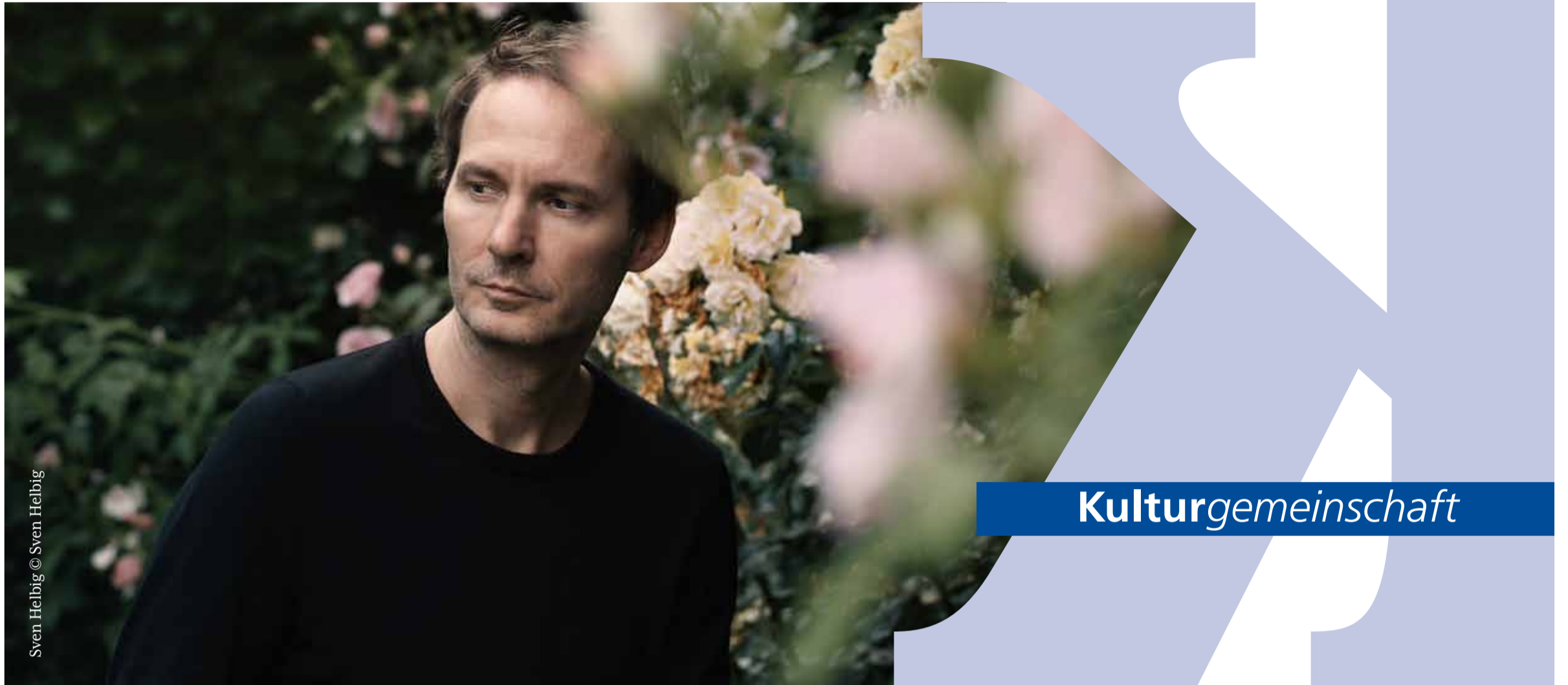
Sven Helbig