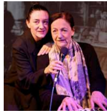
Fisch ohne Fahrrad

Leben, Schicksal und Dichtung von Mascha Kaléko