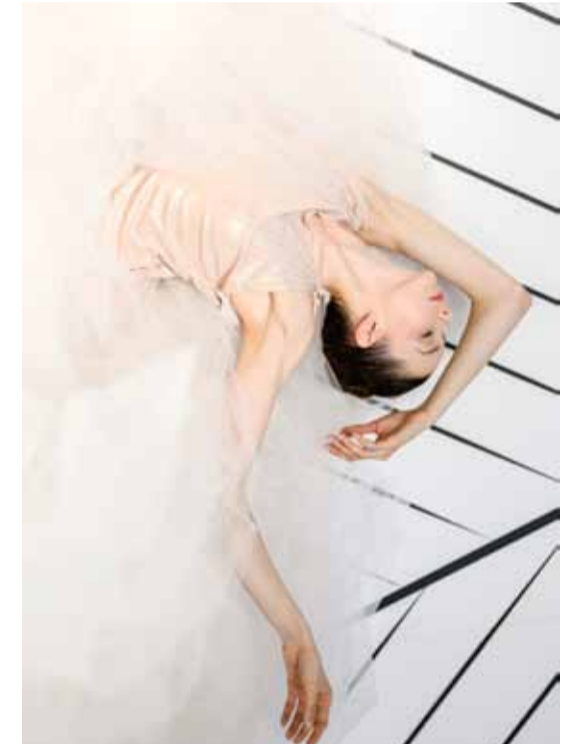
Les Ballets de Monte Carlo