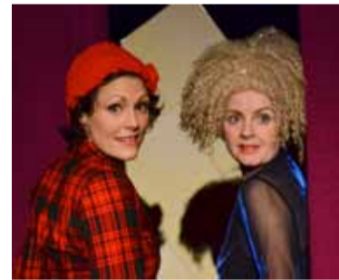
Frauen lügen

Festival SommerZeltSpiele Inszenierung: Alberto Garcia Sánchez Bittersüßer Theaterabend zum Verlieben und Haare-Raufen.