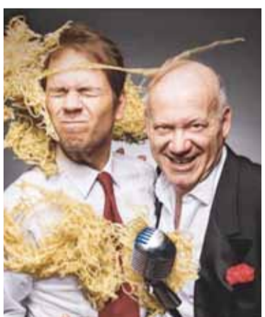
Eros & Ramazotti

Eros & Ramazotti ist eine umwerfende musikalische Komödie voller Leidenschaft, Witz und großen Emotionen.