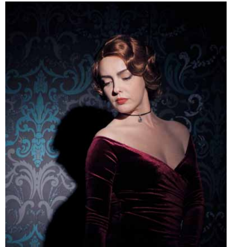
Das Geheimnis ewiger Jugend