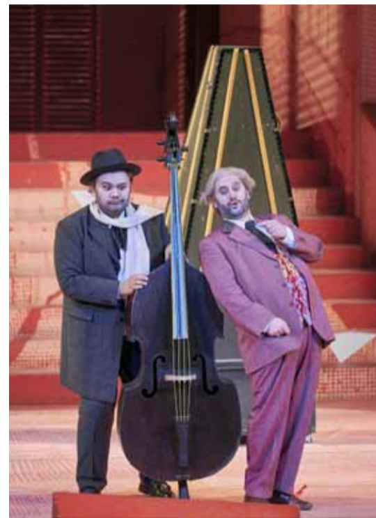
Il barbiere di Siviglia