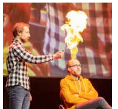
Science Busters © Renitenztheater

Warum der Klimawandel eine Partybremse ist und was der Mensch dagegen machen kann.