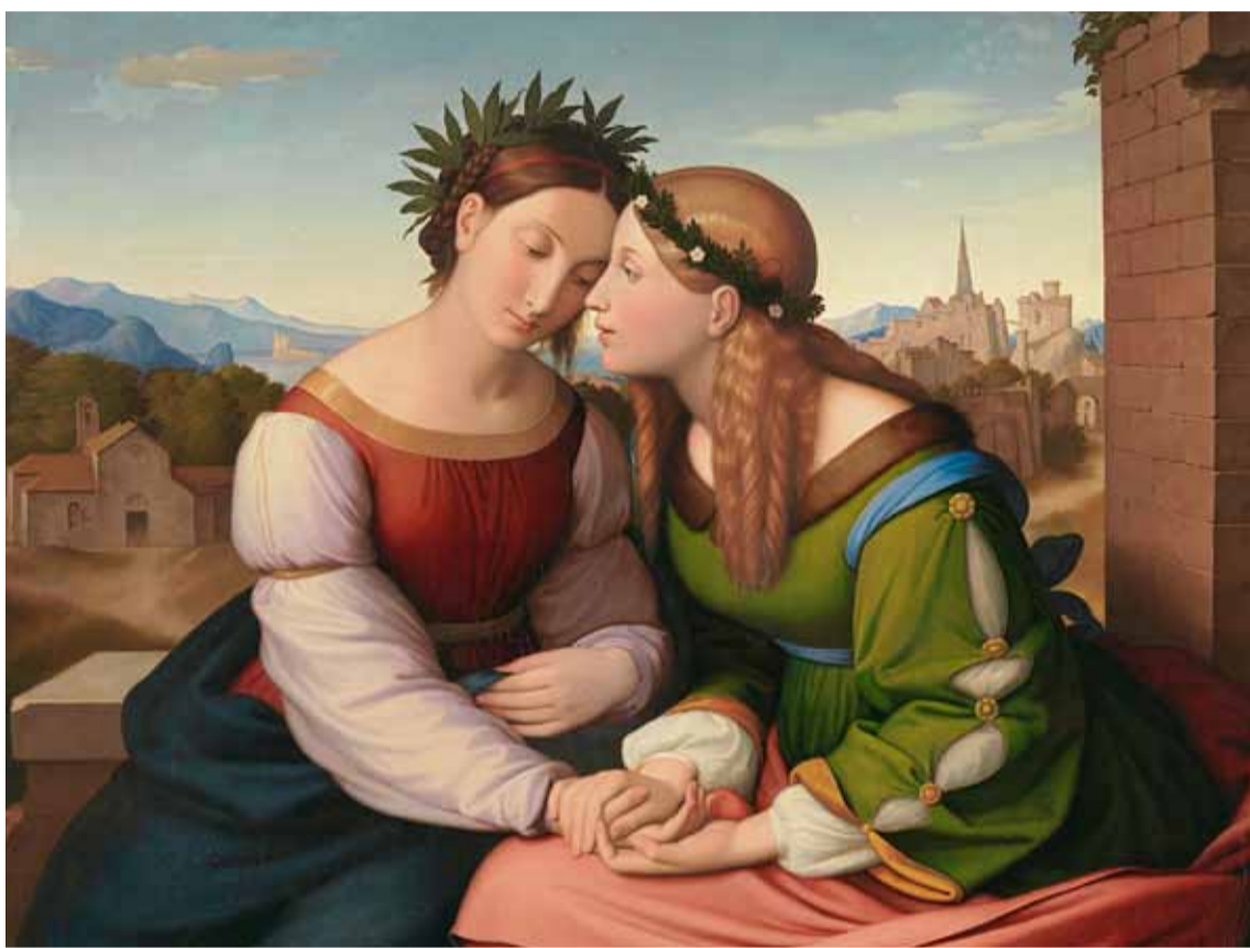
Friedrich Overbeck, 1789, Italia und Germania © Neue Pinakothek München

Mit »Italia et Germania« gehen wir auf Entdeckungsreise. Wir tauchen ein in die Faszination dieses jahrhundertelangen Austauschs, in diese geschichtliche, kulturelle, künstlerische und architektonische Vielfalt.