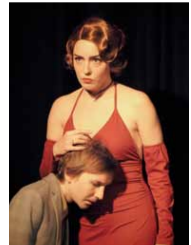
Das Geheimnis ewiger Jugend

Autor: Karel Capek Inszenierung: Vladislav Grabovskiy Im XXI. Jahrhundert taucht plötzlich eine mysteriöse Person auf, die auf unerklärliche Weise jung wirkt. Es scheint, als hütet sie das Geheimnis der ewigen Jugend.