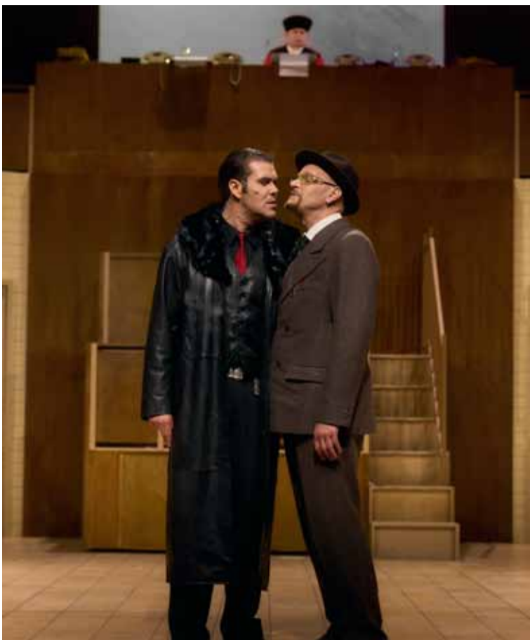
Die Dreigroschenoper

Mo 13.07.2026 19.00 Wenn die Uhren keine Zeiger haben Theaterjurte Festival SommerZeltSpiele Eine Kleinst-Revue mit Texten von Daniil Charms und Karl Valentin.