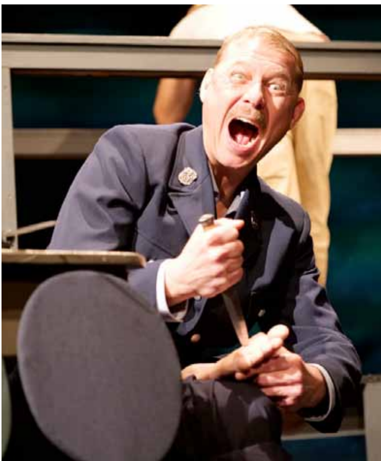
Hin und Her

Di 14.07.2026 19.30 And now Hanau Theaterhaus - T3 Autor: Tuğsal Moğul Inszenierung: Werner Schretzmeier