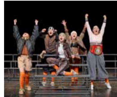
Ladies Football Club

Mi 22.07.2026 19.30 Ladies Football Club ⊙ Württembergische Landesbühne Esslingen