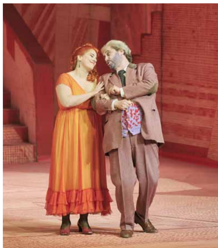
Il barbiere di Siviglia