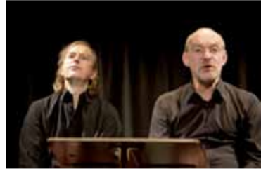
Wenn der Abend durch den Schornstein fällt

Festival SommerZeltSpiele Autor: Hanns-Dieter Hüsche Der Abend lässt noch einmal die schönsten, lustigsten und eindringlichsten Texte und Lieder des »fahrenden Poeten« lebendig werden.