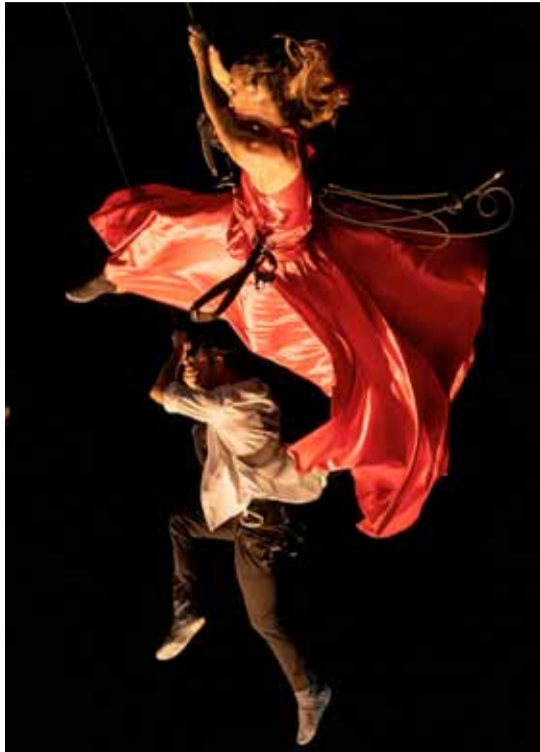
Il Posto