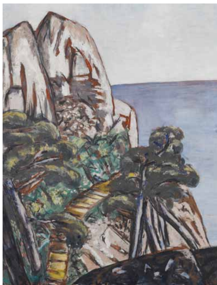
Max Beckmann, Cap Martin, 1939

Als Paul Celan 1952 bei einem seiner ersten Besuche im Nachkriegsdeutschland in Stuttgart aus dem Zug stieg, kam er aus Paris – in Wahrheit jedoch aus einer »versunkenen Heimat«. Er suchte und fand sie nur noch in der Sprache seiner Lyrik. Die tiefe Verbundenheit mit Friedrich Hölderlin, der im »Tübinger Turm« Zuflucht gefunden hatte und dort die 2. Hälfte seines Lebens verbrachte, war Anlass wiederholter Besuche Celans