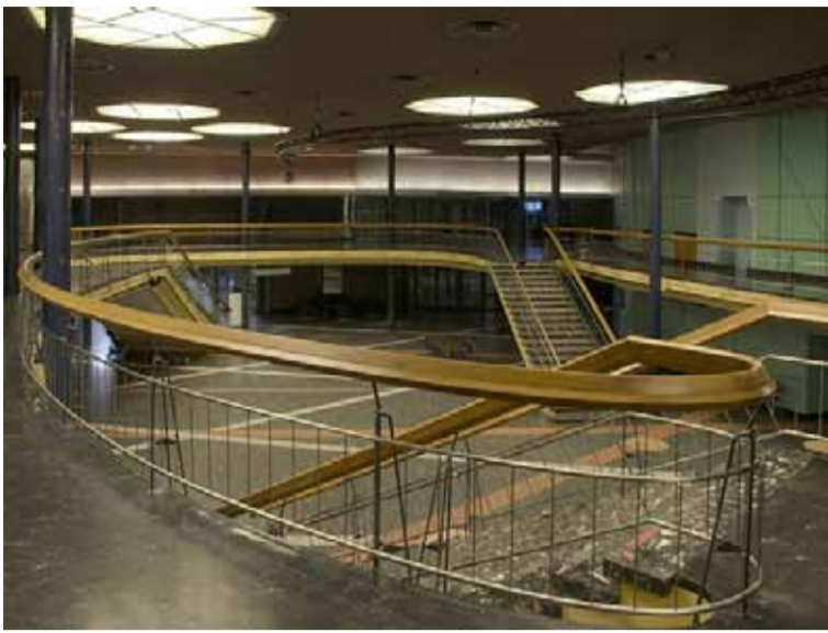
Liederhalle Stuttgart, Foyer