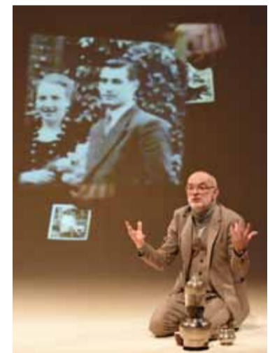
Ein ganz gewöhnlicher Jude

Autor: Charles Lewinsky Inszenierung: Christof Küster Monolog einer Abrechnung.