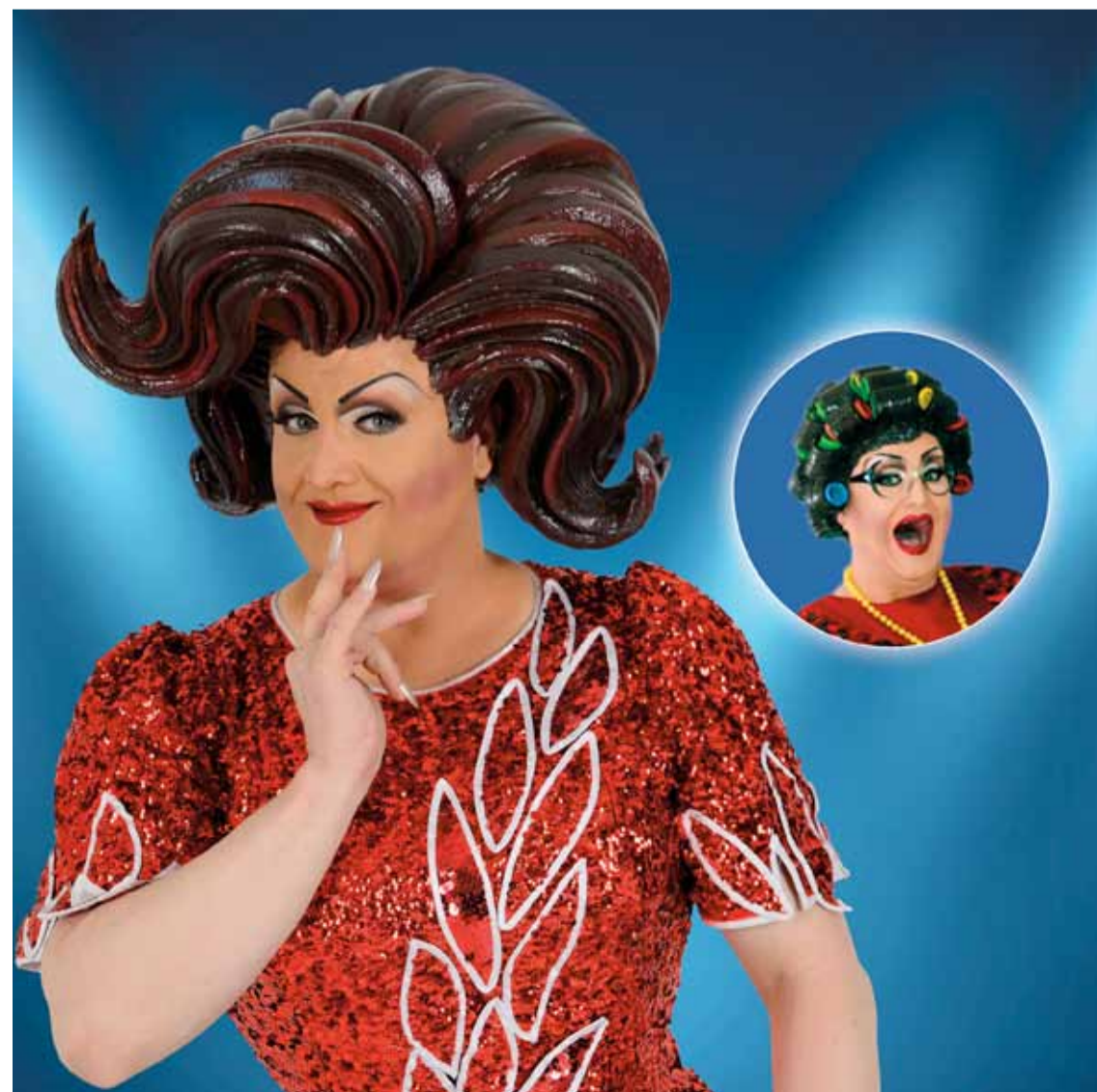
Alles muss raus