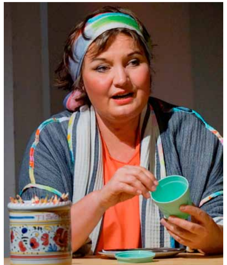
Die kleinen Dinge des Lebens

Fr 17.07.2026 19.30 Ladies Football Club Württembergische Landesbühne Esslingen Autor: Stefano Massini Inszenierung: Laura Tetzlaff