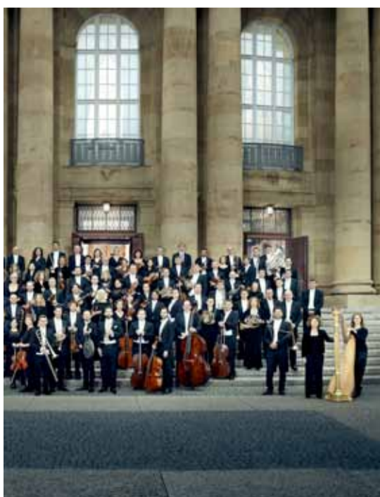
Staatsorchester Stuttgart