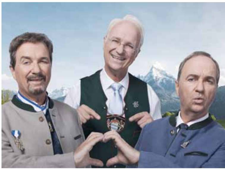
Wolfgang Krebs

Fr 17.07.2026 20.00 Wolfgang Krebs - Bayern liebt DICH! Renitenztheater